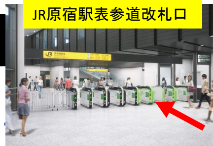
JR原宿駅表参道改札口